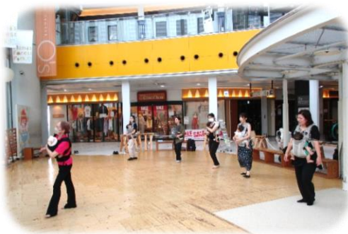
ベビーダンス&キッズベビーダンス