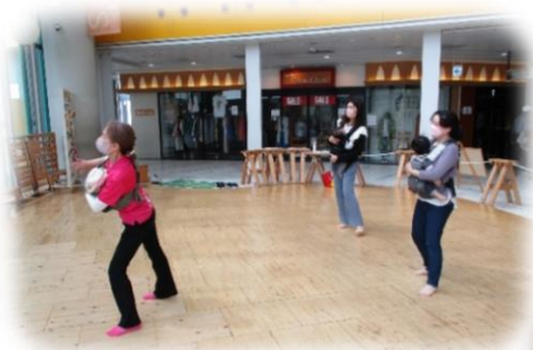
ベビーダンス&キッズベビーダンス